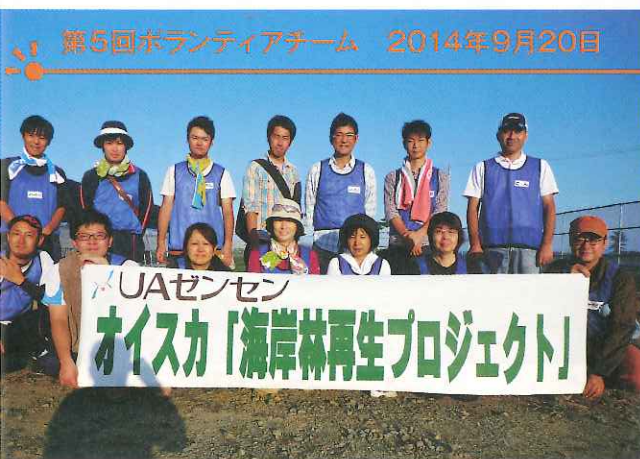
第5回ボランティアチーム 2014年9月20日