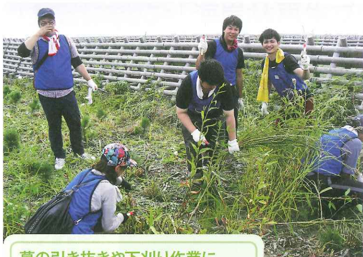
葛の引き抜きや下刈り作業に たくさんの人手が必要

海岸の植栽地で、葛(クズ)の引き抜きや下刈り作業を行う仲間達。夏場には、葛は1日1メートルの勢いで伸びるというから驚く。炎天下、葛との根比べが続いていた。