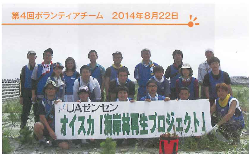
第4回ボランティアチーム 2014年8月22日

ボランティア活動にとりかかる前に、育苗場で説明を受ける仲間達。海岸林の重要性や活動の経緯について理解を深めた